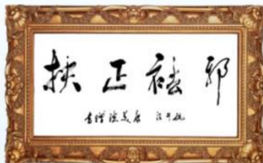
水产动物病理学权威专家汪开毓教授为公司疾病诊疗理念题词