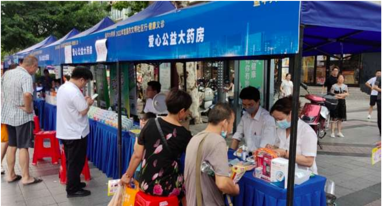
图 2 公司承担社会责任

益事业，经常组织送医送药上山下乡，关注贫困弱势群体，积极助力精准扶贫攻坚，为社会和谐发展贡献力量。每年都会通过各种形式开展近 10000 场健康讲座，介绍健康养生专业知识和生活技巧，服务近 300 万慢病患者及中老年人。通过举办中老年才艺赛、助学助残送温暖、为灾区弱势群体捐款捐物等，