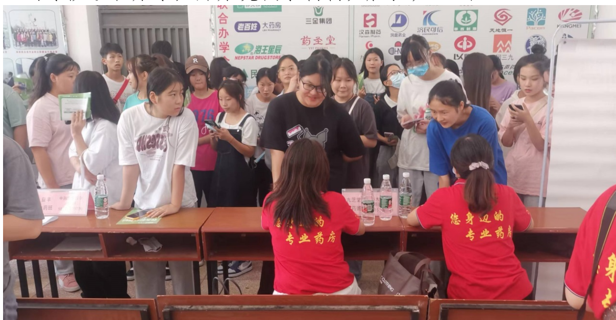
图 3 现代学徒制“益丰班”新生面试

校企组织实施教学方案，共同制订学生考核评价标准，共同做好双导师的教学与监控，共同进行学生实习与就业管理工作。教育教学过程中，公司提供相应的教学资料、师资、实习实训设备及场所等，以产学结合、工学交替、顶岗实习的形式，进一步完善采取“4+2”新型学徒制培养模式，提升学生的动手实践能力、岗位适应能力、团队协作能力。学生在毕业时能快速转变身份，迅速适应公司生产环境。迄今为止，益丰大药房与学院联合办学，开办现代学徒制及店长班 28 个。