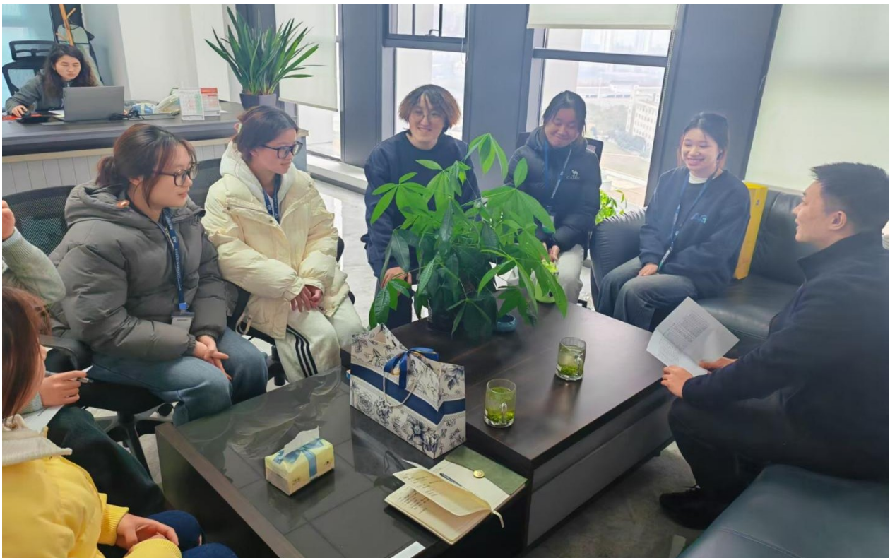
图8 校企收集人才培养反馈意见

校企共同培养人才，实现了学生零距离上岗，一大批优秀学生进入公司实习三个月成为店长、店助等。学生毕业后快速的成为公司的片区经理、营销主管等，充实了公司的职工队伍。常德职院培养的学生为公司的快速发展提供了大量的人力资源和智力支持。