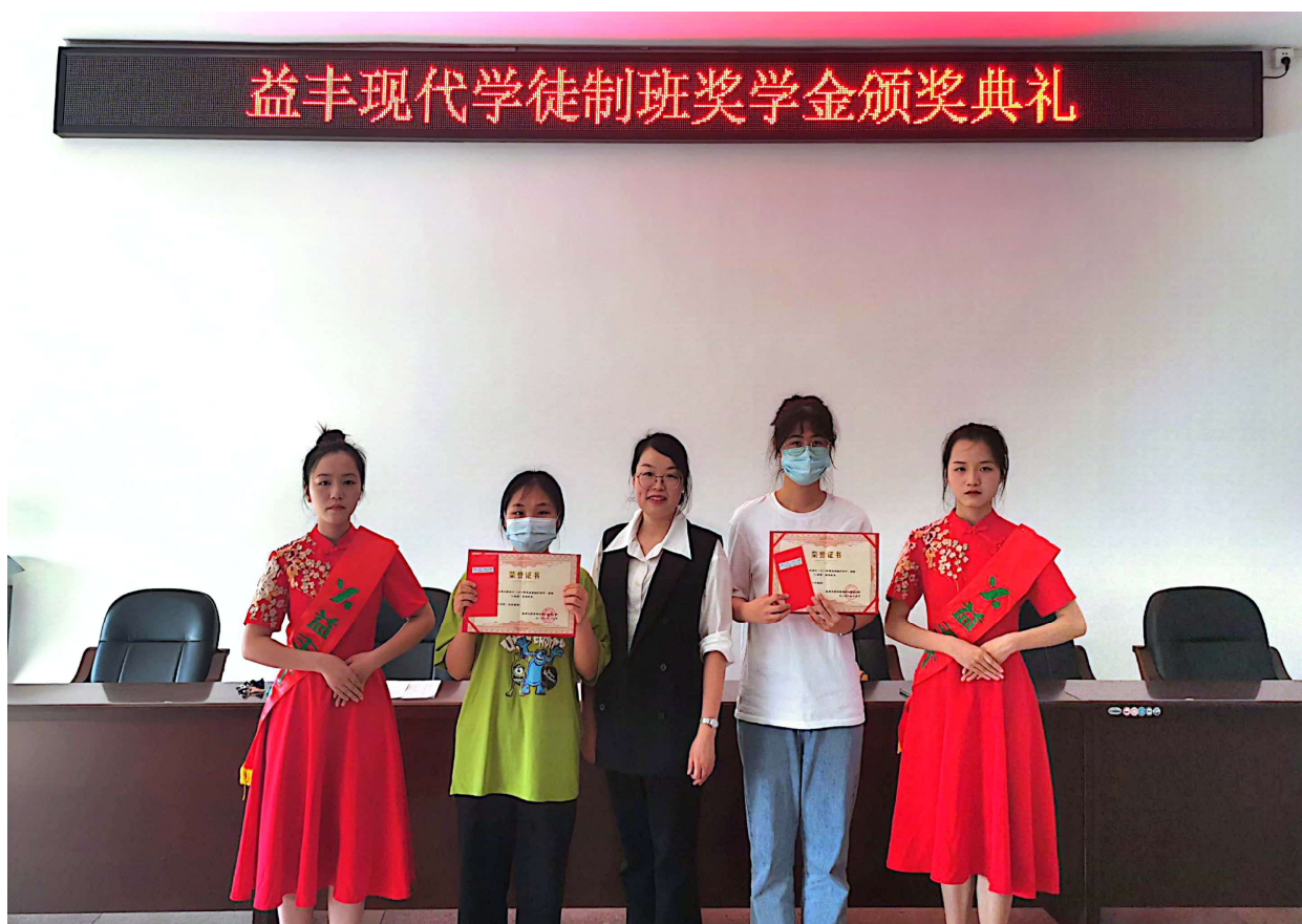
图 4 益丰现代学徒制班奖学金颁奖典礼

公司在常德职院完善了“GSP 标准药房”，丰富学校教育教学资源。为推进 X 证书制度，公司提供“药品购销”职业技能等级证书考证设施设备，作为学生实习实训场地，提升了学生的职业技能。公司每年对现代学徒制及店长班学生进行奖助学金资助近 8 万元，奖励优秀学生学好专业知识，掌握药学等各专业岗位技能。