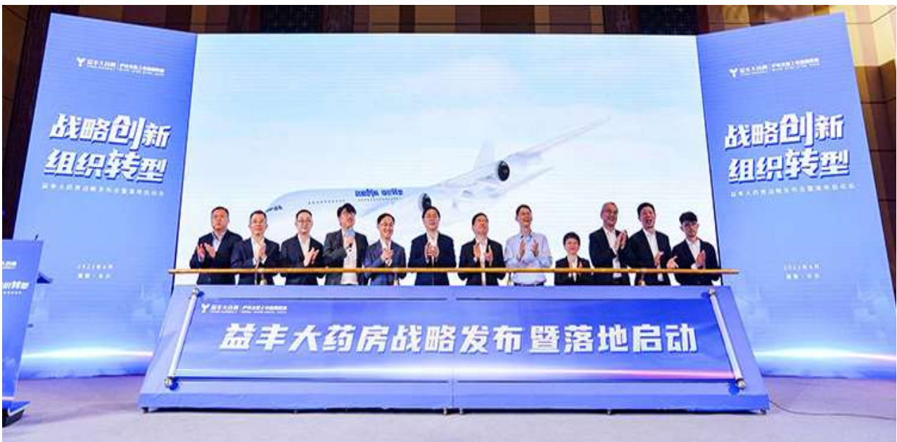
图 1 公司发展战略发布

益丰大药房是全国大型药品零售连锁企业（中国沪市主板上市连锁药房），专注医药零售行业 23 周年，市值稳居国内上市连锁药店前列，被评为中国上市公司 500 强企业。作为中国大健康行业的领军者，益丰大药房于 2001 年 6 月创立，先后布局医药零售、医药批发、中药饮片生产销售、慢病管理、互联网医院、医疗项目投资和医疗科技开发等大健康业态。