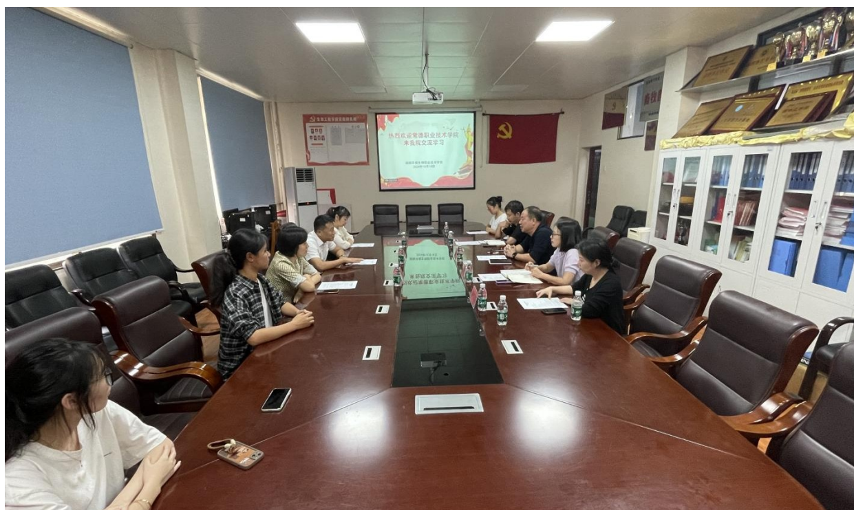
图6 校企研讨人才培养方案

校企共同制定了药学、中药学、药品经营与管理、教学内容与考核标准。修订了药品营销技术、药物制剂技术、药物应用技能、药物商品技术、中药调剂技术、药品调剂实训、药学服务实训、GSP实训等6门核心课程标准、考核标准。共同对学生进行教育教学，学生接受学校和企业的双重管理。