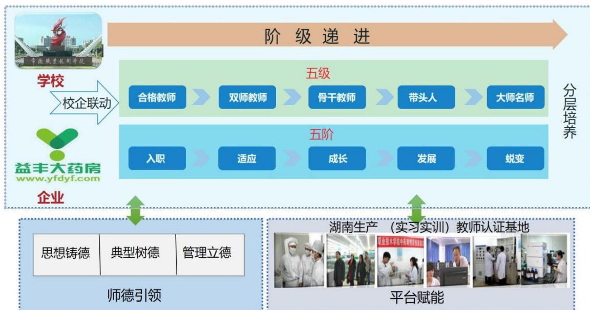
图 1 师资队伍建设的长效机制

建立健全“师德引领，平台赋能，分层培养”的师资队伍建设长效机制，完善合格教师、双师、骨干教师（技术骨干）、双带头人、名师（大师）教师分层培养体系。强化师德引领作用，构建了思想铸德、典型树德、管理立德的“三位一体”师德建设模式。依托湖南省生产性实习实训教师认证基地，通过集中培训、企业实践等为教师赋能，迅速提高青年教师的教学水平，逐步实现专任教师从入职、适应、成长、发展、蜕变五阶梯递进成长。