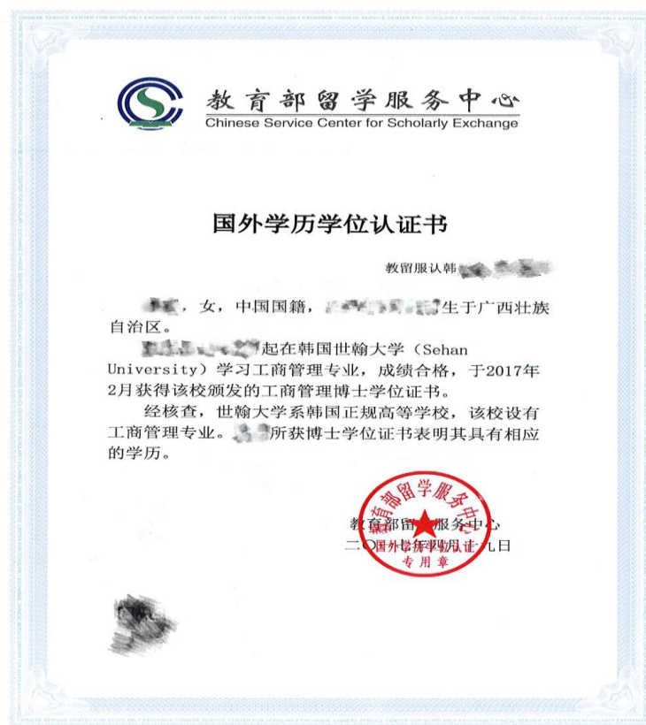
中国教育部留学服务中心世翰大学博士学位认证书