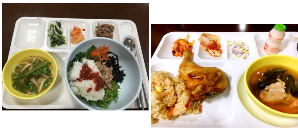
（世翰大学学生食堂实物照片）