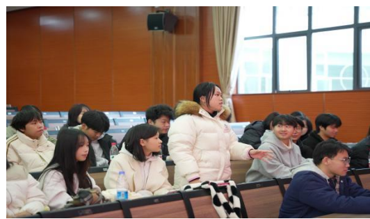
图 28 企业文化讲座