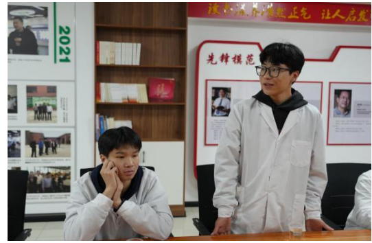
图 8 研学探讨