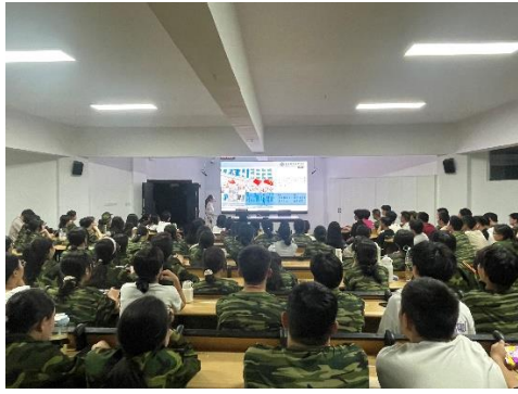
图 21 企业宣讲