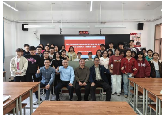
图 11 企业工匠进校园