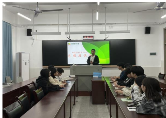
图 14 总裁大讲堂