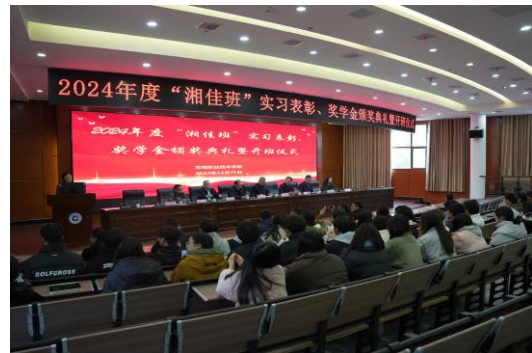
图 26 2024 级“湘佳班”开班