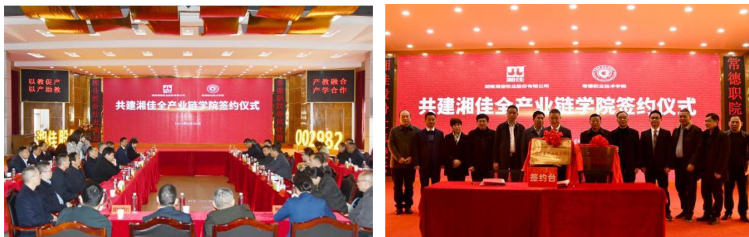
图1、图2 2023年2月校企双方签订了《共建湘佳全产业链学院框架协议》

机制，2023年2月，校企双方签订了《共建湘佳全产业链学院框架协议》，同年7月，校企双方再次签订了《湘佳全产业链学院人才培养协议书》，以深入“校企共同育人、产教研训融合”人才培养机制，培养符合企业需要的畜牧兽医专业人才。