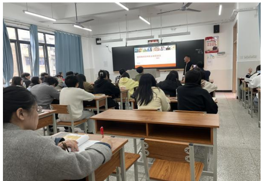
图 12 企业工匠进校园