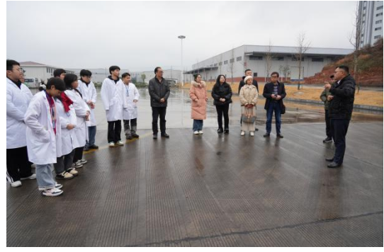
图 6 师生一行参观原料仓