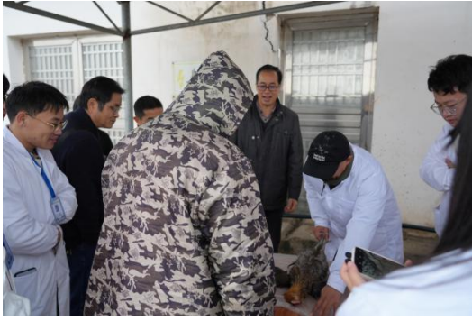
图 5 指导解剖实操