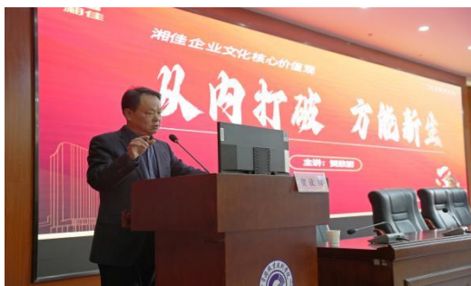
图 27 企业文化讲座