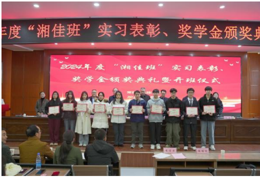
图 23 2023 级“湘佳班”实习表彰