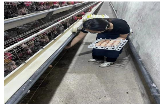
图 20 蛋鸡实习岗