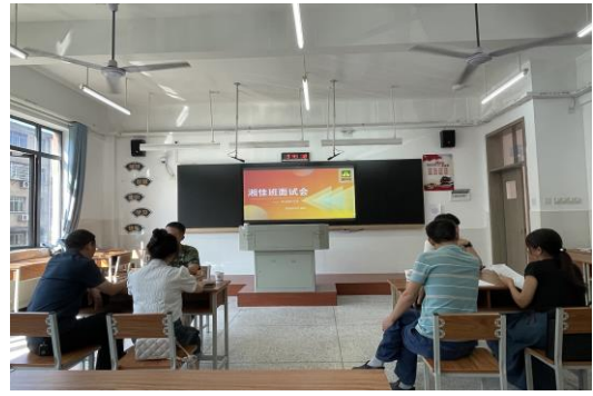
图 22 2024 级“湘佳班”面试