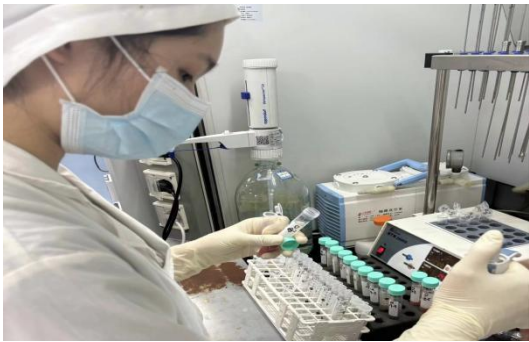
图 17 检测实习岗