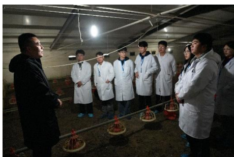
图 29 专业教师实地授课

在专业教师和企业导师的共同指导下，畜牧兽医专业学生在2024年世界职业院校技能大赛总结书争夺赛中取得佳绩，获得铜奖一项；同时，教师教学能力竞赛也获得好成绩，湖南省“楚怡杯”教师教学能力竞赛《智慧养鸡》课程获得省二等奖一项。