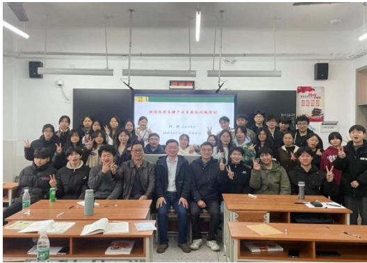
图 13 企业工匠进校园