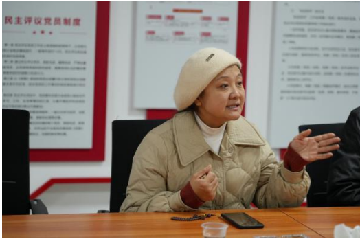
图 9 研学探讨