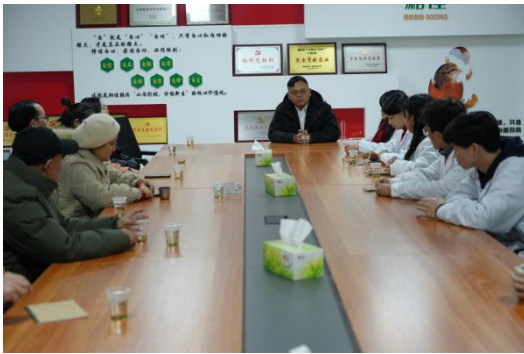
图 7 研学探讨