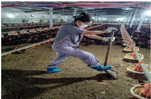
图 19 肉鸡实习岗