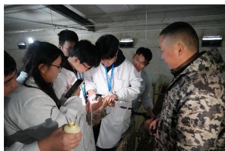
图 30 企业导师实践教学