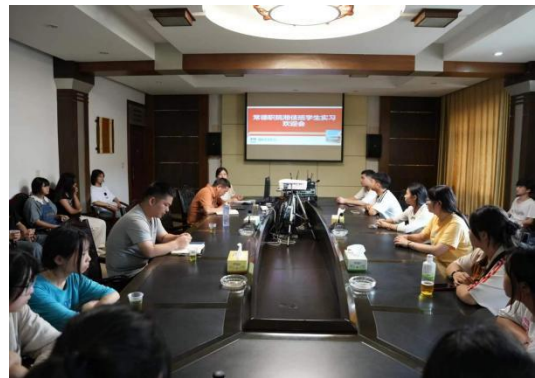
图 16 2023 级“湘佳班”实习动员会