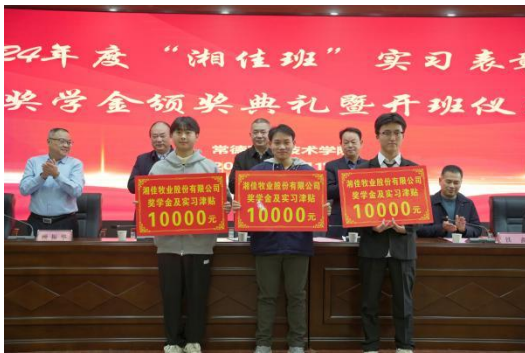
图 25 2023 级“湘佳班”优秀实习生授牌