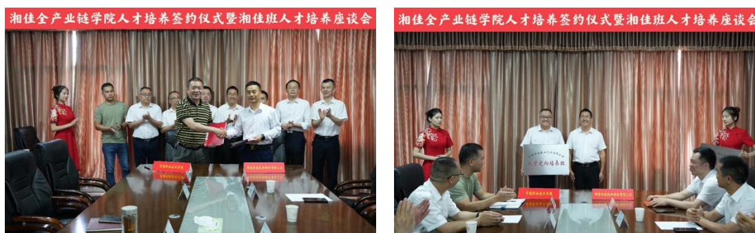
图3、图4 2023年7月校企签订《湘佳全产业链学院人才培养协议书》