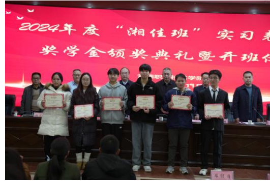
图 24 2023 级“湘佳班”奖学金颁奖