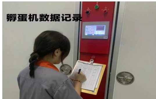
图 18 孵化实习岗