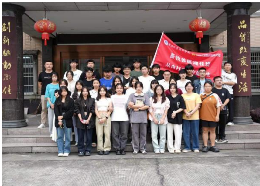
图 15 2023 级“湘佳班”企业实习合影