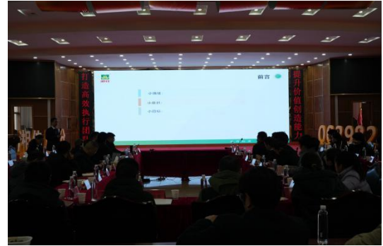
图 10 湘佳牧业年度工作总结和技术培训会议