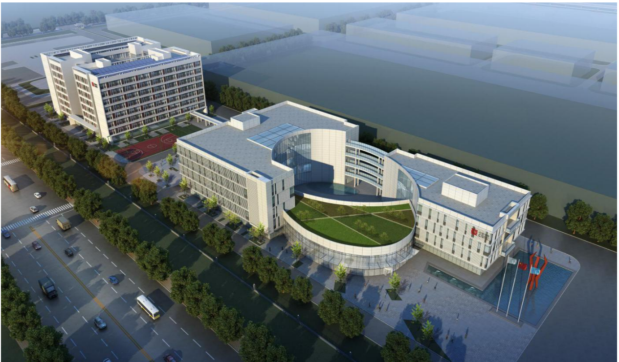
办公楼、宿舍远景图