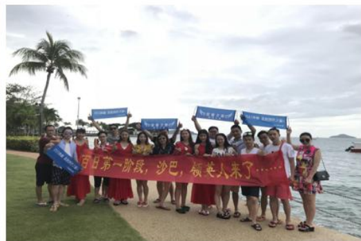
百日冲刺“精英”海外游