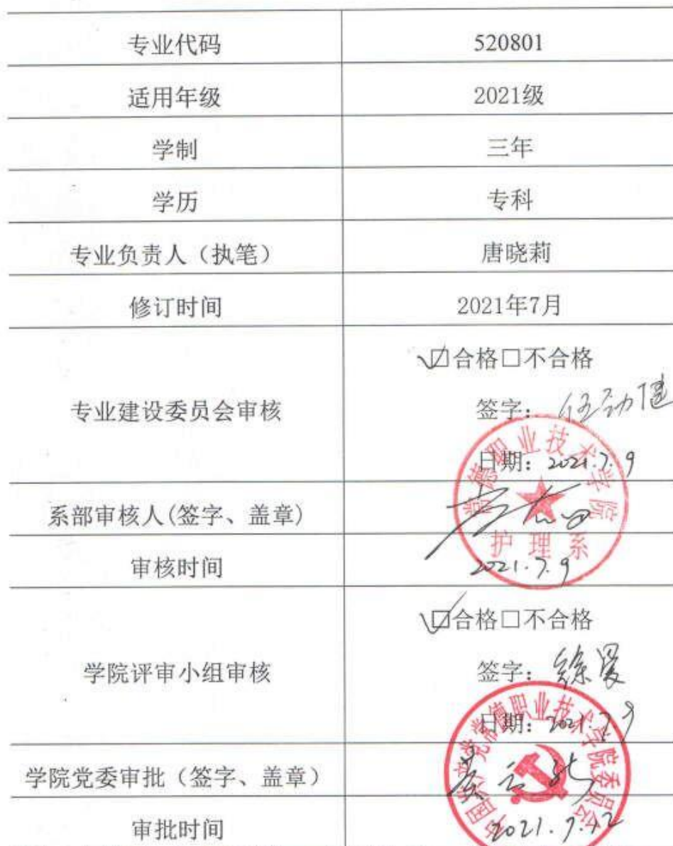
2021 级 健康管理 专业人才培养方案审批信息表

说明:本人才培养方案适用于统招、单招三年制大专。对退役军人、下岗职工、农民工、新型职业农民单独制定人才培养方案。校企合作班级在国家教学标准基础上可以增加企业特色课程,人才培养方案单独制定。