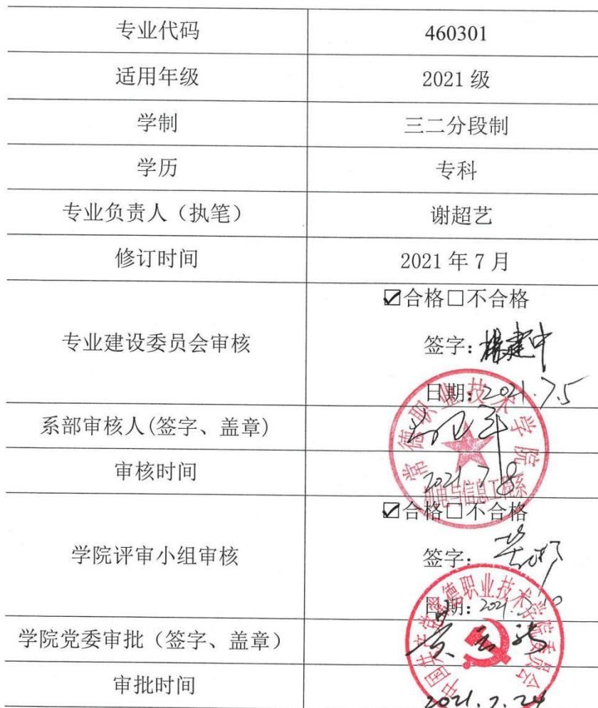
2021 级 机电一体化技术(三二分段制) 专业人才培养方案审批信息表

说明: 本人才培养方案适用于三二分段制大专。对退役军人、下岗职工、农民工、新型职业农民单独制定人才培养方案。校企合作班级在国家教学标准基础上可以增加企业特色课程,人才培养方案单独制定。